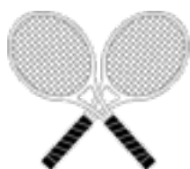
TENNIS CLUB MANETTI Circolo Tennis dal 1958